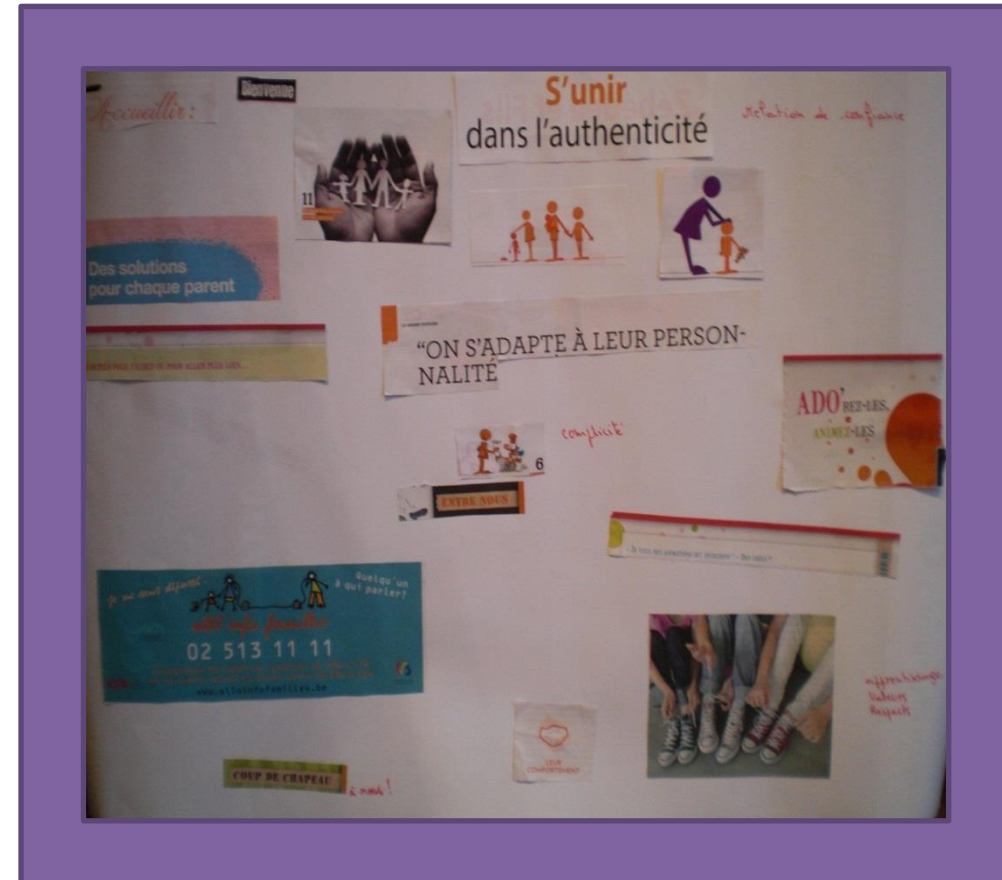
Tableau 4 « relation de confiance avec les parents »

L'accueil (et nos plaines de vacances) s'engage à respecter les convictions idéologiques, philosophiques, ou politiques des enfants et de leurs parents.