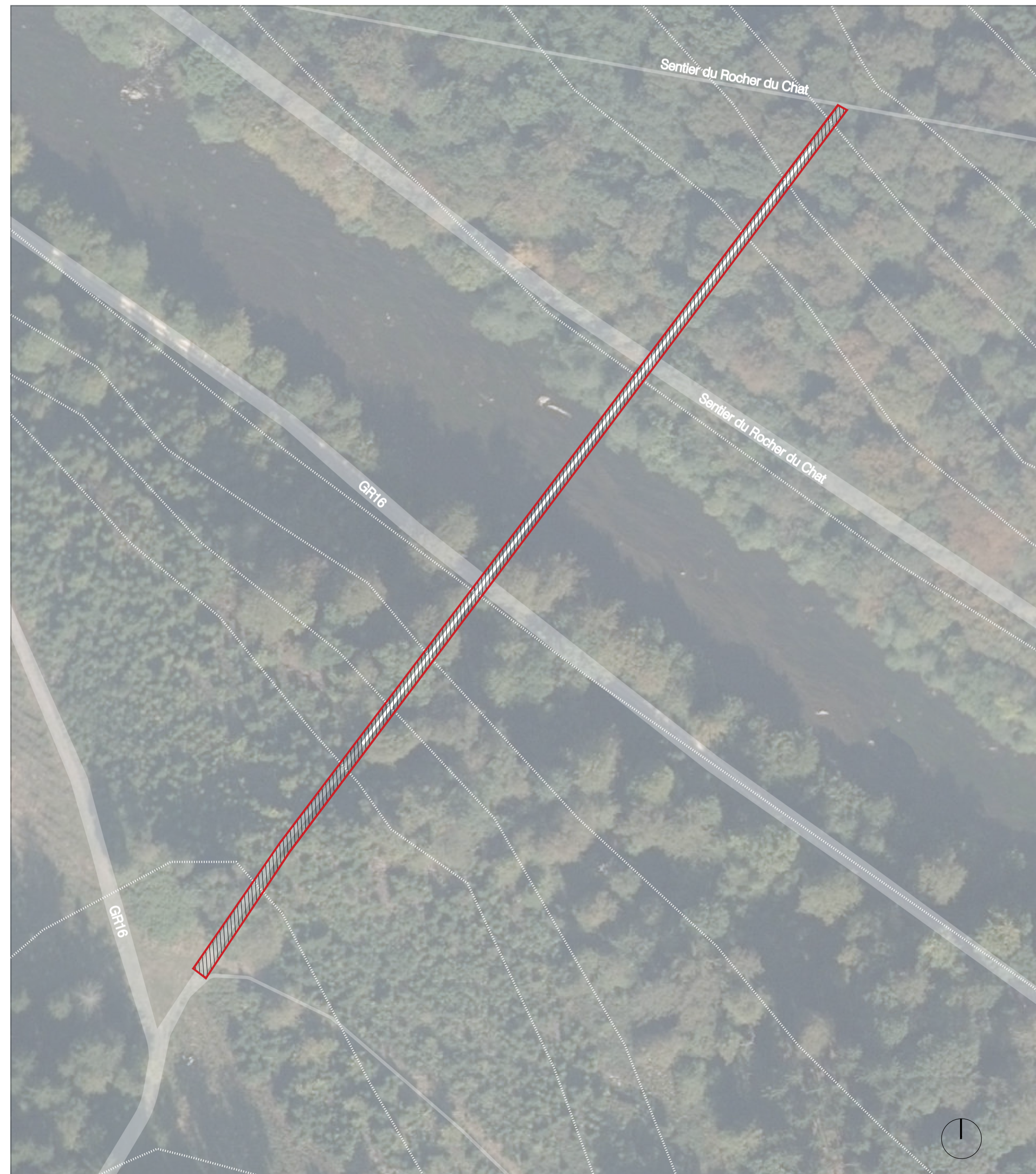
Plan d'implantation Ech. 1:1000